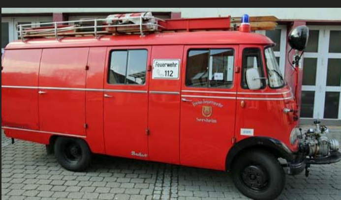
Löschgruppenfahrzeug LF 8 (Bj. 1966) Feuerwehr Sersheim