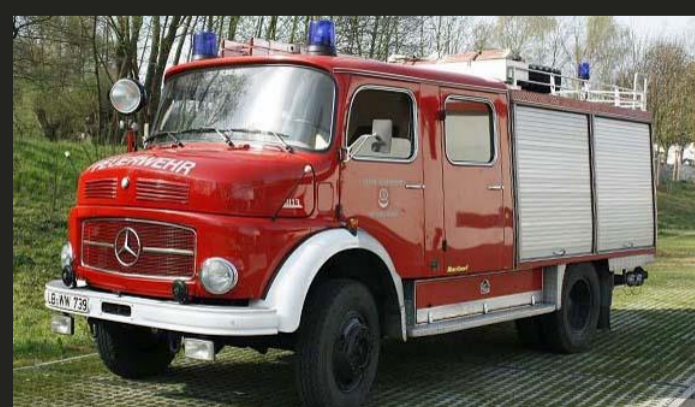
Tanklöschfahrzeug (Bj. 1976) Feuerwehr Bönningheim