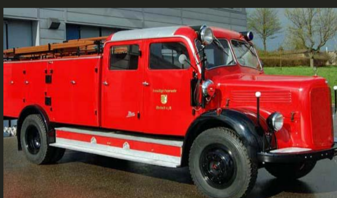
Tanklöschfahrzeug TLF 15 (Bj. 1955) Feuerwehr Marbach