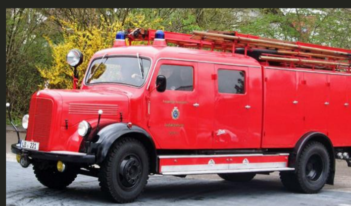
Löschfahrzeug LF 16 (Bj. 1957) Feuerwehr Ludwigsburg