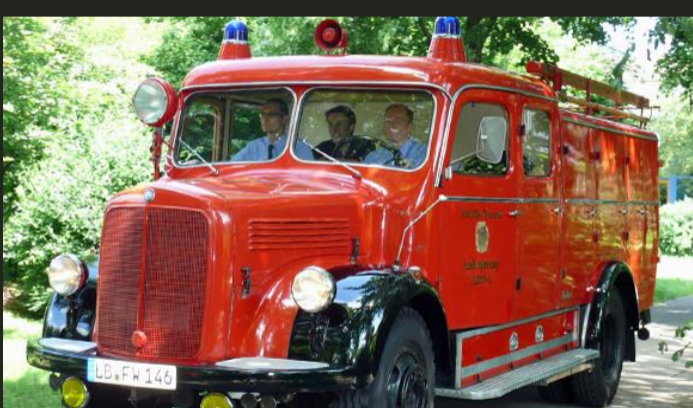
Schlauchwagen SW 2000 (Bj. 1961) Feuerwehr Ludwigsburg