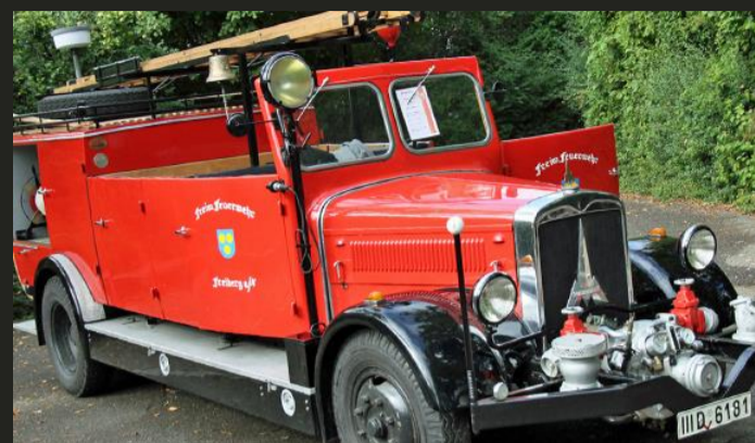
Kraftfahrerspritze 25 (Bj. 1937) Feuerwehr Freiberg