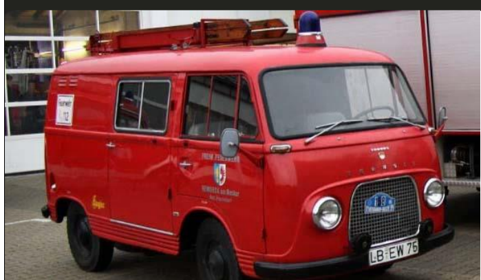
Tragkraftspritzenfahrzeug (Bj. 1964) Feuerwehr Remseck