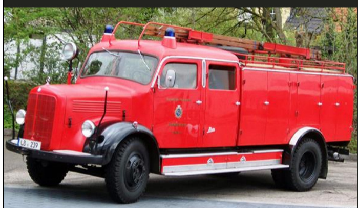
Tanklöschfahrzeug TLF 16 (Bj. 1958) Feuerwehr Ludwigsburg