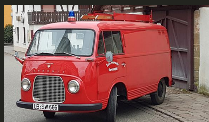
Tragkraftspritzenfahrzeug (Bj. 1961) Feuerwehr Oberstenfeld