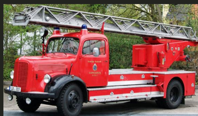
Drehleiter DL 25h (Bj. 1959) Feuerwehr Ludwigsburg