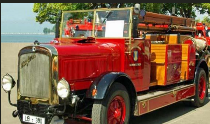
Kraftfahrerspritze 25 (Bj. 1929) Feuerwehr Kornwestheim