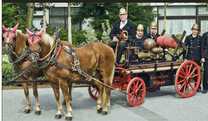
Handdruckspritze (Bj. 1863) Feuerwehr Ditzingen