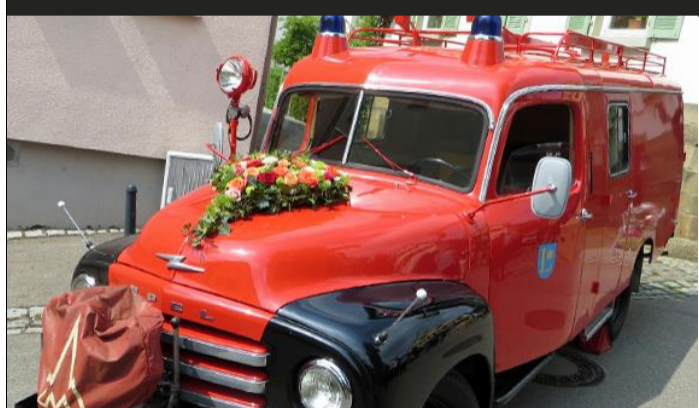
Löschgruppenfahrzeug LF16TS (Bj.1959) Feuerwehr Löchgau