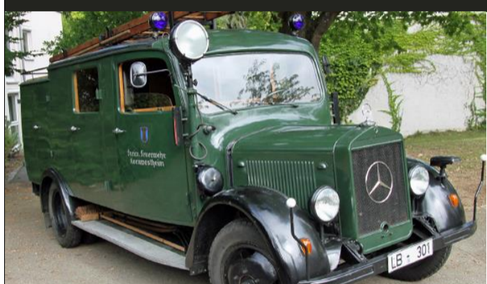
Leichtes Löschgruppen-Fzg. (Bj. 1941) Feuerwehr Kornwestheim